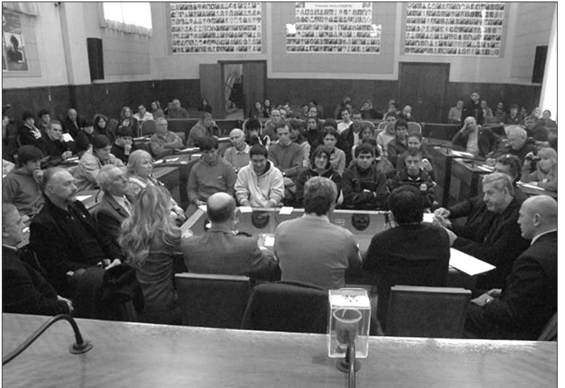
Los especialistas en energías respondieron preguntas del público en la jornada que se realizó ayer en el HCD.

Por otra parte, el referente aseguró que “encuentros como este son importantes para acercar los conocimientos a la gente. La sociedad tiene que saber, aprender, que la energía es tan impor-