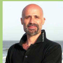
AUTOR José Luis APREA

En los reactores nucleares alimentados con uranio natural debe usarse agua