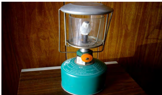
Farol a gas tipo “Sol de Noche”

En los campamentos o excursiones de pesca, frecuentemente se encuentran estos dispositivos utilizados para la iluminación en lugares en los cuales no hay suministro de electricidad por red. Su principal característica consiste en que posee una manta luminosa, conocida comúnmente como “camisa”, que brilla poniéndose incan-