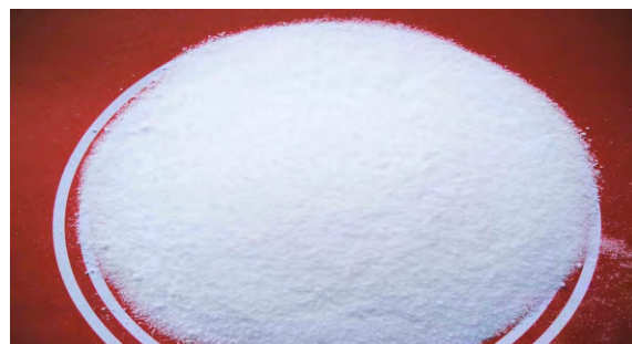
Nitrato de potasio

Se conocen 17 isótopos del potasio y sólo 3 son naturales (K-39, K-40, K-41). Entre ellos, el principal por su abundancia relativa es el K-40, que es radiactivo y se transforma con una vida media de 1.250 millones de años en argón-40 y calcio-40. La desintegración radiactiva del K-40 en Ar-40 se emplea como método para la datación de