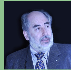
Autor: Salvador Gil

actualmente hay tecnología para reemplazar estos pilotos por sistemas de encendido electrónico, se vuelve imperioso redefinir las normas actuales de modo de inducir a los usuarios y fabricantes de equipos a hacer un aprovechamiento más eficiente de la