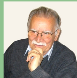
Autor: Osvaldo Cristallini

Se trabajó, al igual que en la primera etapa, a nivel de trazadores pero, además de la técnica de precipitación, se incorporaron nuevas técnicas separativas, tales como: destilación, extracción por solventes o intercambio iónico, etc., para separar el radioisótopo de interés del